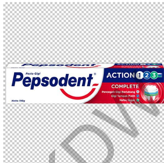
Gambar 1.2 Pasta Gigi PEPSODENT

Pepsodent adalah pasta gigi yang paling terkenal dan tertua di Indonesia, sejak awal keberadaannya selalu memberikan keunggulan yang diminati oleh pelanggan. Pepsodent secara aktif mendidik dan mempromosikan kebiasaan menyikat gigi secara benar melalui program sekolah dan layanan pemeriksaan gigi gratis. Sejak itu Pepsodent telah melengkapi jajaran produknya mulai dari pembersihan dasar hingga pasta gigi dengan manfaat lengkap.