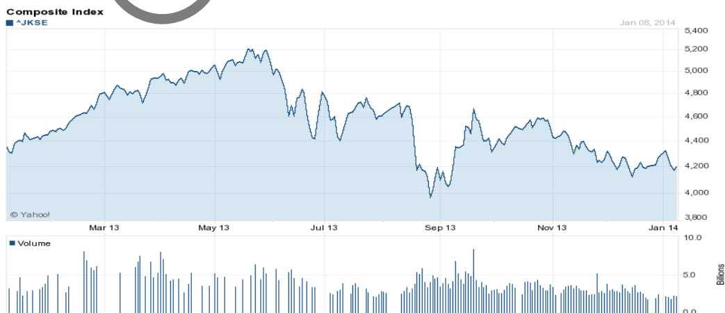
Gambar 1.5.1 Grafik IHSG

Dalam gambar grafik diatas menunjukkan terjadinya kenaikan kurs transaksi selama periode Maret 2013 hingga September 2013.