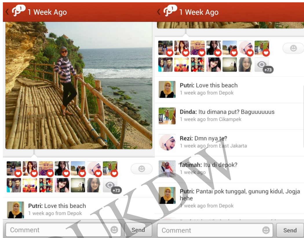
Gambar 1.1 komunikasi Word of Mouth melalui media sosial

Selain disampaikan oleh travel blogger , komunikasi Word of Mouth juga dapat disampaikan melalui media sosial, dan pesan instan. Komunikasi Word of Mouth secara natural dilakukan oleh seorang wisatawan secara sukarela, tanpa dibayar perusahaan. Saat wisatawan merasa tidak ada kepentingan untuk mempromosikan produk, komunikasi Word of Mouth yang muncul bisa positif atau negatif, untuk itu perusahaan perlu mengelola percakapan yang muncul melalui media sosial. (Mikalef et al, 2013; See-To et al, 2013)